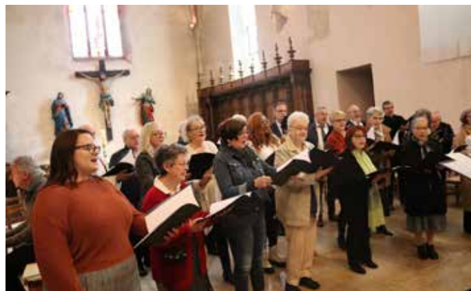
Le 150 e anniversaire de la Sainte-Cécile de Porrentruy a été fêté le 27 novembre, à l'église Saint-Pierre.