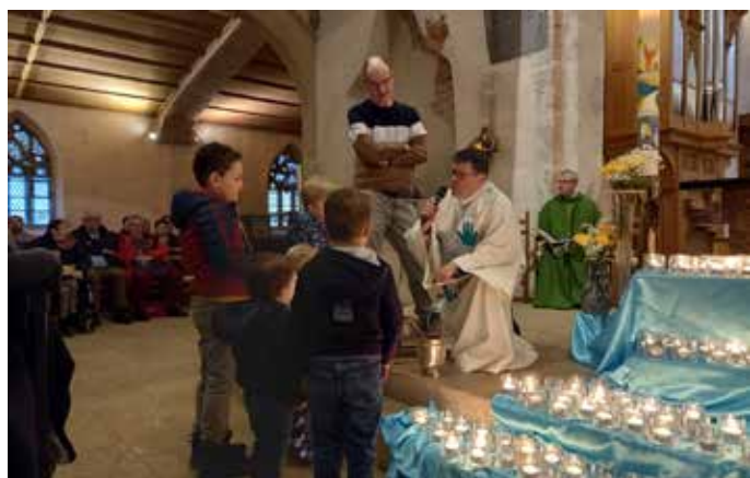
Célébration des baptisés, dimanche 15 janvier, à Porrentruy