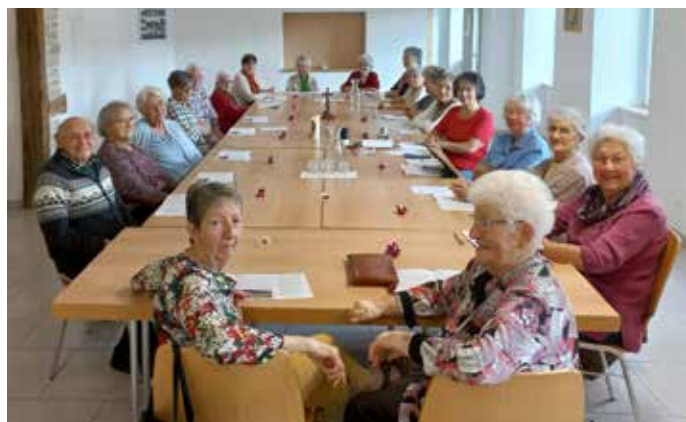
Rencontre du MCR de la paroisse Saint-Martin