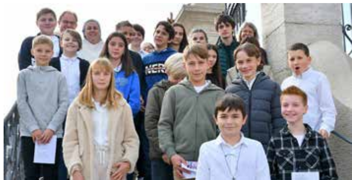
Confirmation à Courgenay, dimanche 6 novembre