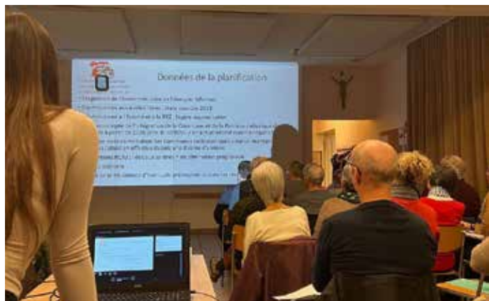
L'Assemblée de la Collectivité ecclésiastique cantonale (CEC) s'est déroulée le 28 novembre 2022, à Develier.