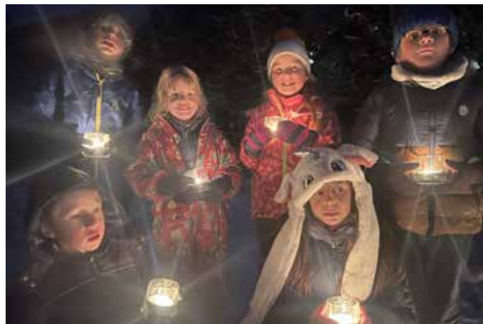
Au soir du 17 décembre, l'action « Un million d'étoiles » a illuminé le ciel de plusieurs localités, comme ici à Courrendlin.