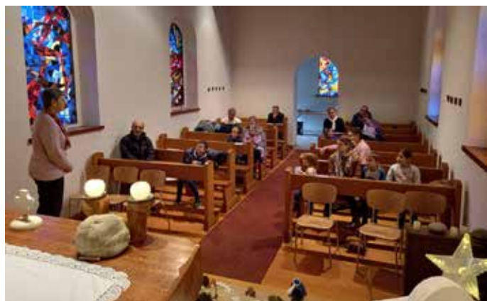
Vivre les Rois en famille, Roche-d'Or le 6 janvier