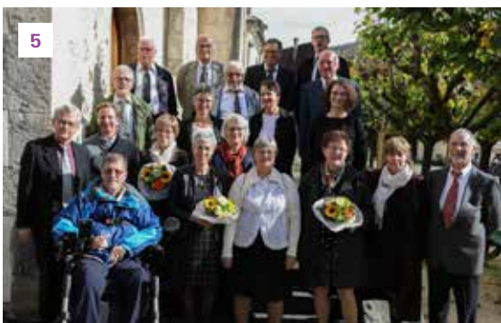
De longues fidélités ont été célébrées et chantées aux quatre coins de l'Espace pastoral.