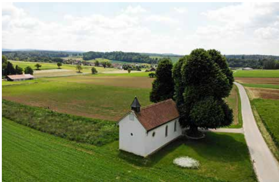
La chapelle de saint Imier à Lugnez, à découvrir avec 80 autres sites sur : www.cath-ajoie.ch/eglises-et-chapelles

Ces lieux, souvent charmants, incitent à la prière en toute simplicité et la facilitent. Un groupe de personnes a profité de cette période particulière pour mieux les faire connaître et les mettre en valeur sur notre site : www.cath-ajoie.ch/eglises-et-chapelles . De magnifiques balades à pied ou à vélo en Ajoie et dans le Clos du Doubs y sont proposées, avec pour étapes des oratoires, grottes, chapelles et églises de la région. Chaque endroit est présenté