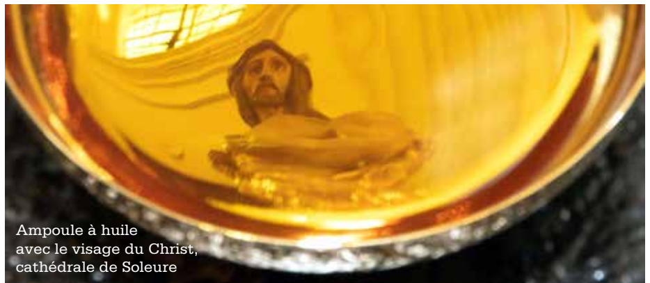
Ampoule à huile avec le visage du Christ, cathédrale de Soleure