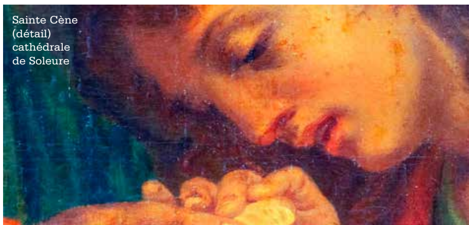
Sainte Cène (détail) cathédrale de Soleure

Alors que les relations humaines se construisent dans la proximité, l'épidémie impose la distanciation. Le paradoxe est tel que c'est par cette distanciation qu'on prouve sa solidarité et son affection. Durant le déconfinement, les gestes tactiles d'amitié sont déconseillés. Les espaces du vivre ensemble sont envisagés avec suspicion, alors qu'ils étaient, jusque-là, des moyens d'endiguer les excès de l'individualisme. Déjà victimes d'isolement, les aînés risquent d'être encore plus esseulés, après avoir payé un lourd tribut en termes de victimes durant la pandémie. Par ailleurs, la confiance sociale déjà fragile, semble avoir été affectée. Les personnes représentant un danger de propagation ou issues des régions surexposées sont stigmatisées. Le soupçon et la méfiance l'emportent au moindre indice de symptôme.