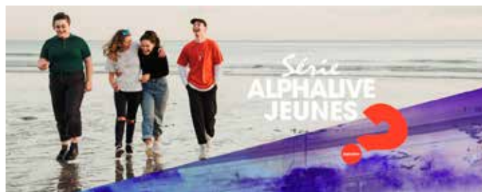
Alpha Live propose aux jeunes d'aborder, avec leurs amis, les grandes questions de la vie.

Pour découvrir, nous vous donnons rendez-vous sur www.cath-ajoie.ch/jeunes