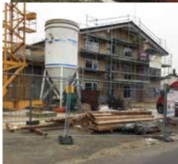
La pose des fenêtres

l'hiver permettant ainsi aux travaux intérieurs de se poursuivre. A ce jour, les installations sanitaires et électriques sont en place, les crépis réalisés.