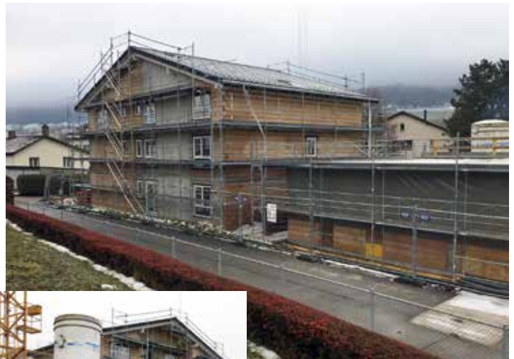
La façade nord

Avec de bonnes conditions météo, on a vu ces constructions s'élever rapidement et à fin novembre, les deux immeubles étaient sous toit. Dès lors, la dalle de la salle polyvalente était coffrée puis coulée. Ensuite, les travaux se sont poursuivis jusqu'à la veille de Noël. Toutes les portes et fenêtres ont pu être posées avant la venue de