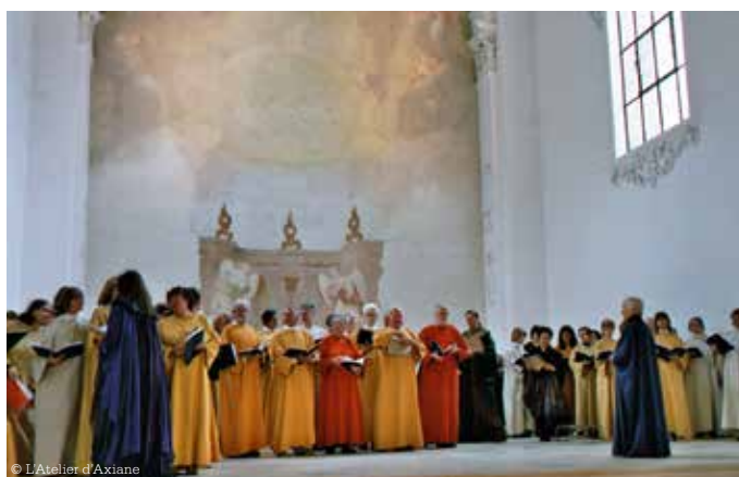
Le chœur Venance Fortunat chante le MS 18 à Bellelay

Depuis 2014, année du tricentenaire de la reconstruction de l'abbatiale de Bellelay, un comité interreligieux organise régulièrement des événements culturels dans les murs de l'église en lien avec l'histoire du lieu et de sa région. Ainsi, des vêpres musicales ont lieu tous les 2 e dimanches du mois (pour ne pas interférer avec nos messes de l'Ensemble Pastoral à Tavannes le premier dimanche) à 17 h sur place. Ainsi qu'un concert de Noël et de très nombreuses expositions ou événements, tout au long de l'année, comme la participation à la Fête de la Tête de Moine au début mai.