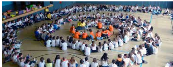
Rassemblement Romand Villars-le-Terroir, 2015

C'est avec un réel et magnifique élan que les enfants et les jeunes s'impliquent dans la mise en œuvre de ce projet lancé à la fin octobre 2017. A cette date, l'équipe du Staff est née. Depuis, de nouveaux jalons ont été posés en vue de ce grand événement. Le Staff concocte les retrouvailles festives de toutes les équipes MADEP romandes. Au programme de la journée figurent un atelier de création, des jeux collaboratifs, une chasse au trésor, un partage convivial autour d'un repas ainsi qu'un temps de prière. Animé tous les deux ans à tour de rôle par les différents cantons, ce type de rassemblement met en avant la participation des