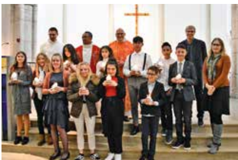
Sacrement de la confirmation 2018

De bien jolies crèches à Saint-Imier et à Corgémont