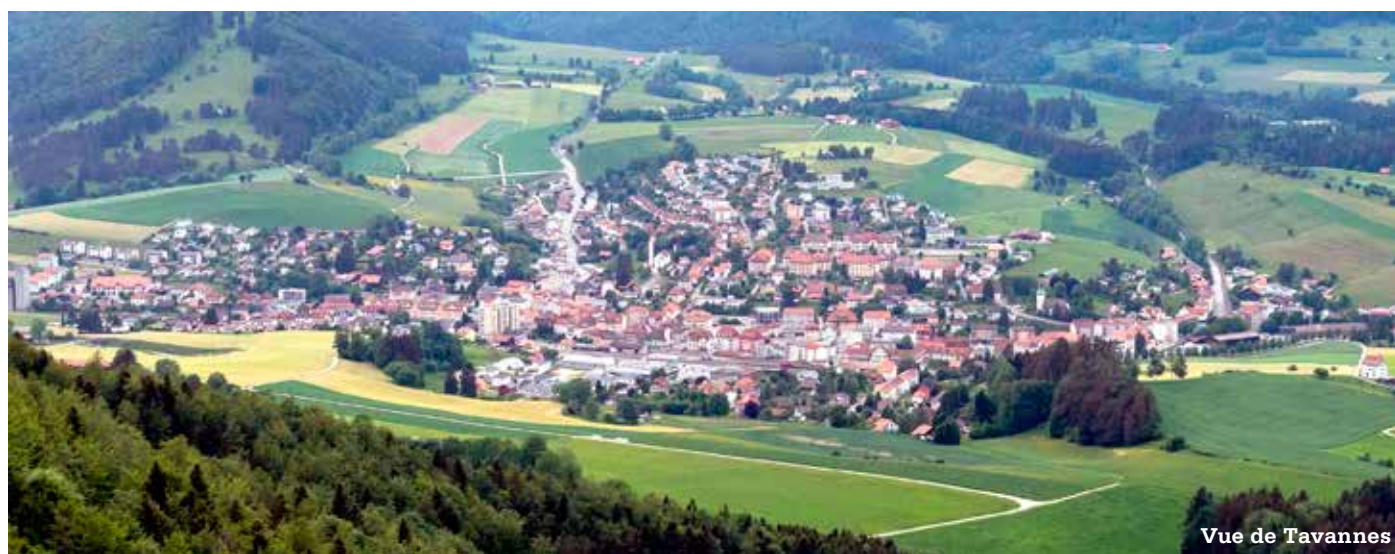
Vue de Tavannes