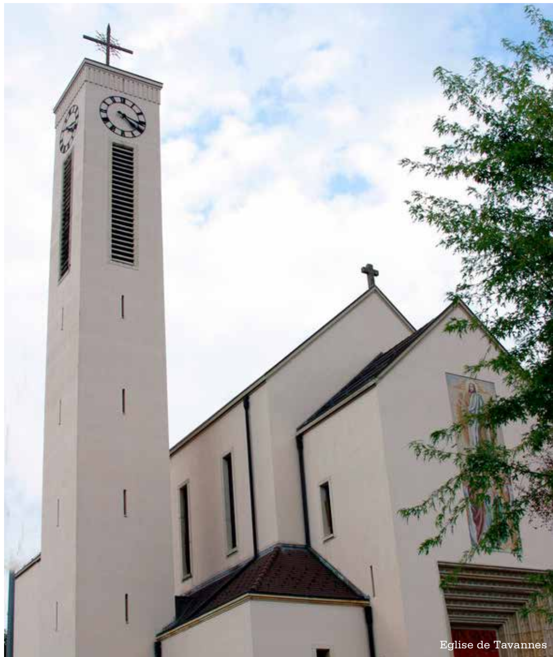
Eglise de Tavannes

Une messe est régulièrement célébrée tous les premiers dimanches du mois à 17h30 à Tavannes.