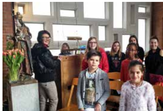
Alegria anime la messe du 26 février