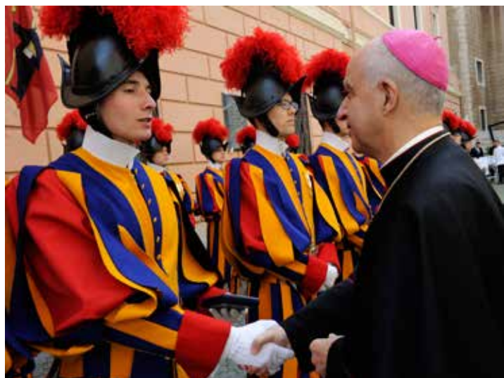
Garde Suisse Pontificale / Artymiak

[...] Quand on vient d'une petite paroisse, on ne voit que peu de jeunes à la messe, alors qu'ici il y a énormément de gens du monde entier et donc beaucoup de jeunes. C'est un peu comme si chaque jour était un jour de fête et encore plus lors de grands événements. Ça donne un espoir supplémentaire si on se sent seul ou si on a peur d'affirmer sa foi. [...] Durant le service et le temps libre, nous pouvons nous retrouver dans la chapelle de la Garde où nous prions ensemble le chapelet. Il arrive même qu'on s'y retrouve spontanément ou que l'on s'y donne rendez-vous en s'envoyant des messages. [...]