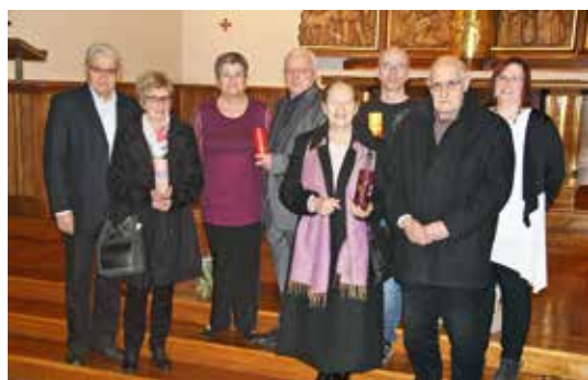
Fête de l'Amour