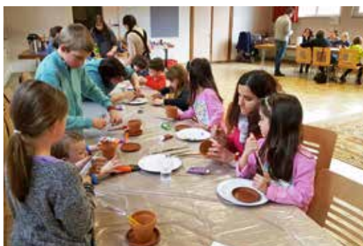
Les enfants de l'Eveil à la foi