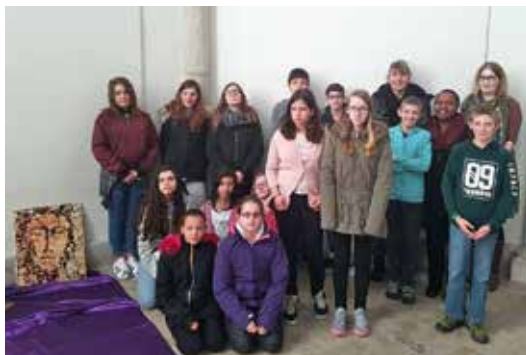
Les confirmands 2017