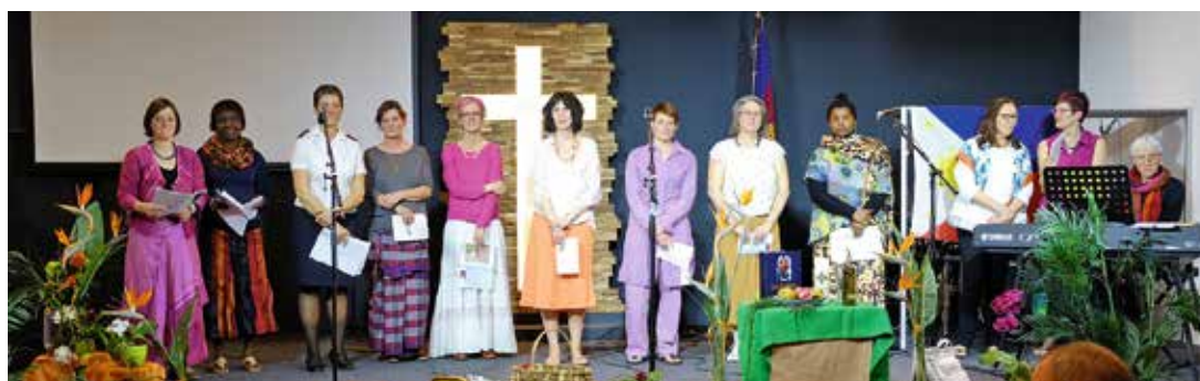
JMP à Tramelan