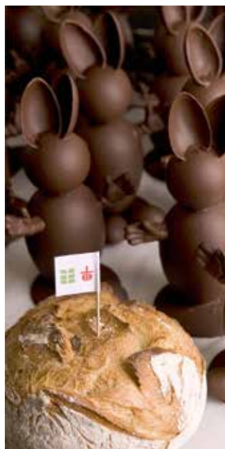
Pain du partage