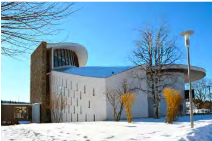
L'église du Noirmont

Vendredi 14 mars, 20h, à Saint-Imier, assemblée