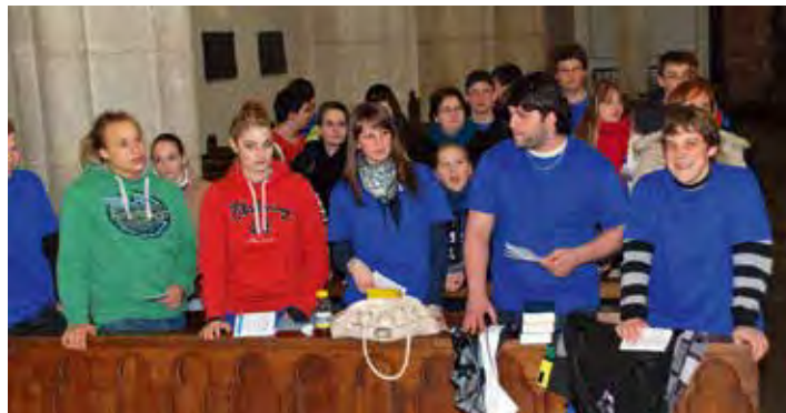
MvP 2013 à Saint-Imier.

Parmi les nombreuses activités destinées aux jeunes des paroisses de l'ensemble pastoral Pierre-Pertuis, il y en a une qui ne cesse de rassembler et de concentrer particulièrement l'attention et l'enthousiasme des jeunes. Nous voulons parler de la Montée vers Pâques (MvP).