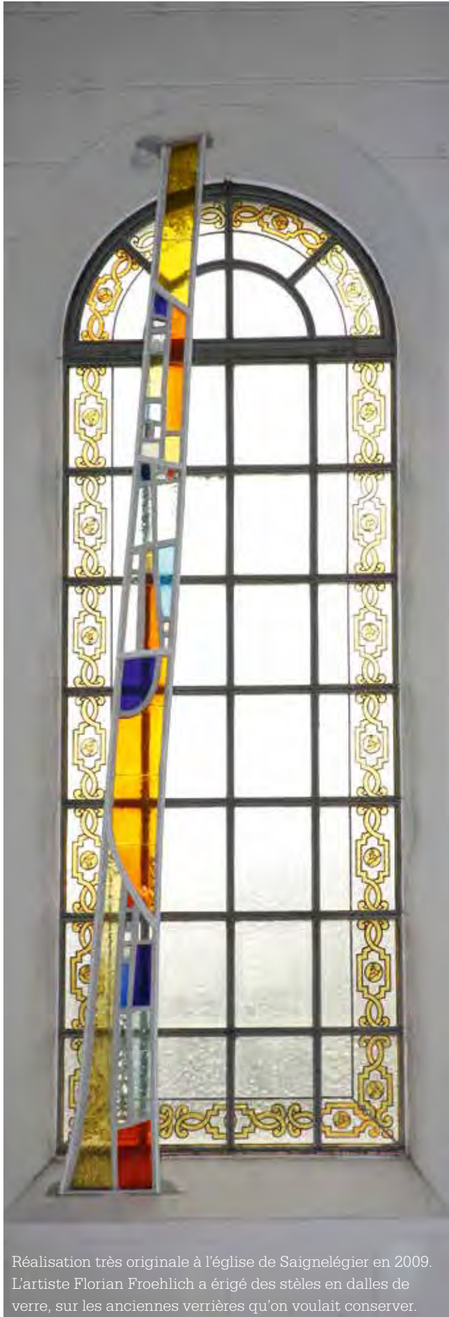
Réalisation très originale à l'église de Saignelégier en 2009. L'artiste Florian Froehlich a érigé des stèles en dalles de verre, sur les anciennes verrières qu'on voulait conserver.