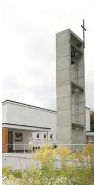
La chapelle de Reconvilier