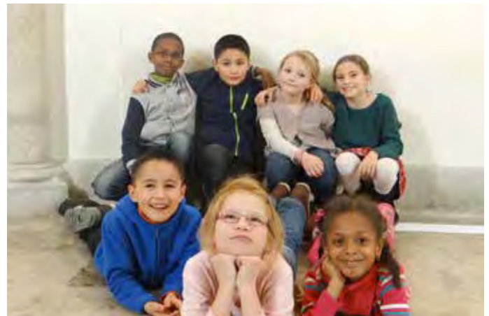
Chœur d'enfants Alegria