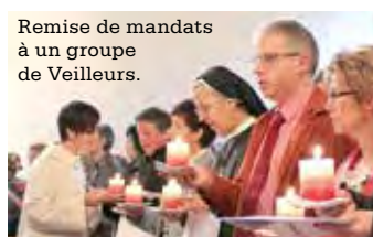
Remise de mandats à un groupe de Veilleurs.

Parce que nous sommes insérés dans un quartier ou un village, nous connaissons tous des situations qui mériteraient qu'on s'y arrête, pour un coup de pouce ou une adresse. De nombreuses personnes sont déjà attentives à ce que se passe autour d'elles et viennent volontiers en aide. Mais il nous arrive aussi parfois ne pas savoir que faire. Au nom de qui et comment intervenir?