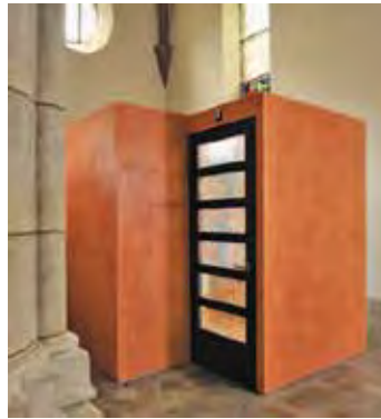
Eglise de Saint-Imier: lieu de la réconciliation

De nos jours, beaucoup s'interrogent sur la raison d'être du sacrement de la réconciliation. Ne pourrait-on pas croire et prier sans forcément le recevoir? Le carême est un temps propice pour expérimenter ce sacrement, et à travers lui, redécouvrir ce Dieu qui nous aime et nous appelle, qui nous éclaire et nous pardonne, et qui nous envoie.