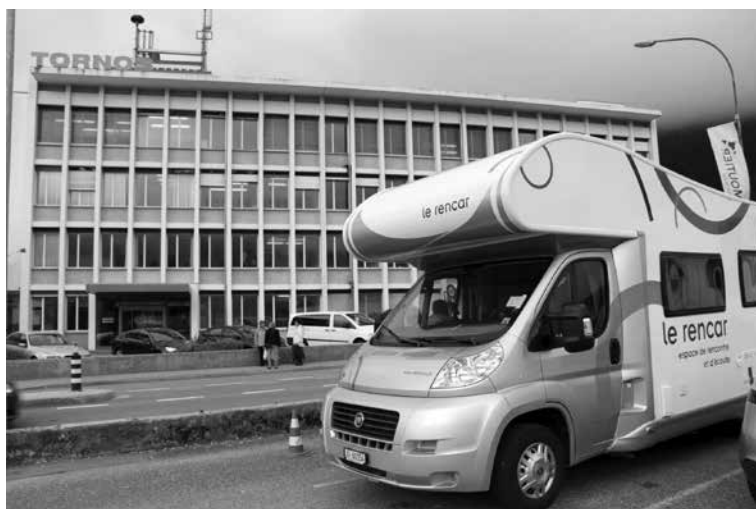
Présence d'écoute et d'accompagnement de la PMT et du Rencar lors des licenciements de la Tornos en septembre 2012

« Si la PMT ne peut se contenter de dénoncer les injustices du monde du travail, il n'en demeure pas moins qu'elle est appelée à rendre compte dans la société et dans l'Eglise de ce que vivent les travailleurs et les demandeurs d'emploi. Avec eux et en leur nom, la PMT est res-