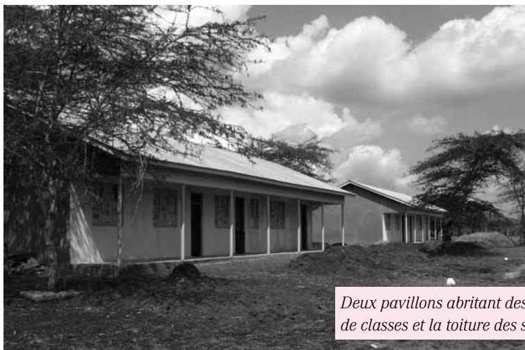
Deux pavillons abritant des salles de classes et la toiture des sanitaires

Merci à chacun et chacune d'entre vous pour votre participation, votre partage et votre générosité. Et surtout un grand MERCI aux équipes de cuisine, spécialement celle de la Saint-Martin qui a concocté de savoureux plats.