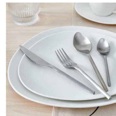
TAVOLA FRATERNA 2024/2025

Le persone interessate sono gentilmente pregate di annunciarsi alla segreteria il venerdì che precede la data prescelta.